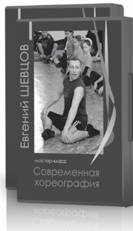
Цена 2 DVD 396 руб.

Вы так же можете приобрести мастер-класс Евгения Шевцова по современной хореографии и видеовеерсии других танцевальных дисциплин в редакции проекта «Танцевальный клондайк».