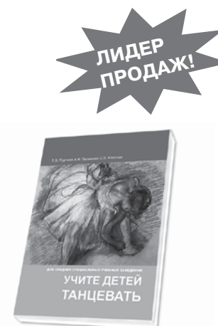
Цена книги 324 руб.