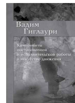
Цена книги 146 руб.