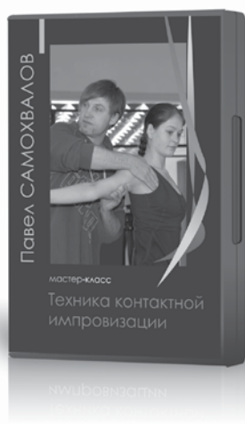
Цена диска 396 руб.

В детстве занимался классическим и эстрадным танцем, позднее — бальным. Закончил Самарский институт культуры. Преподавал хореографические дисциплины в общеобразовательной школе. Современным танцем занимается больше трех лет