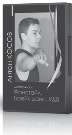
Цена диска 396 руб.

Столь ранняя педагогическая деятельность и изучение пантомимы позволило разработать свой подход к преподаванию современного танца, объединяющий пластику, современный танец и пантомиму.