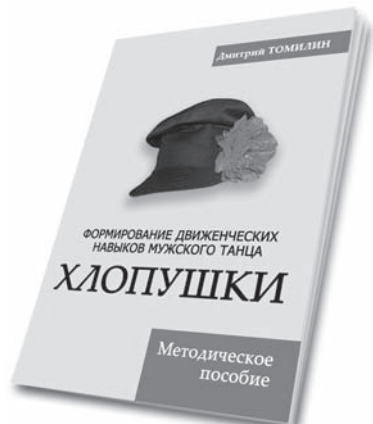
Цена книги 160 руб.