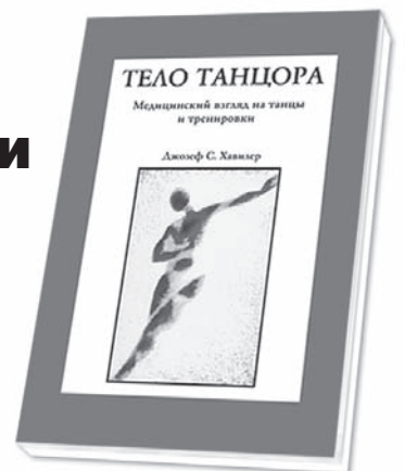
Цена книги 170 руб.

Как избежать вывихов и синяков? Как защитить свои мышцы и кости? Какие бывают суставы и какие для них нужны упражнения? Какое танцевальное движение на какую часть человеческого тела рассчитано? А если травма все-таки произошла, что нужно сделать в первую очередь, чтобы потом не жалеть об этом всю жизнь? Может ли вальс повредить сухожилия? Сколько лет надо разминаться, чтобы красиво исполнить де ми плие? Чтобы не кусать локти, надо беречь колени. Чем опасна растяжка?