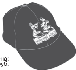
Цена: 110 руб.