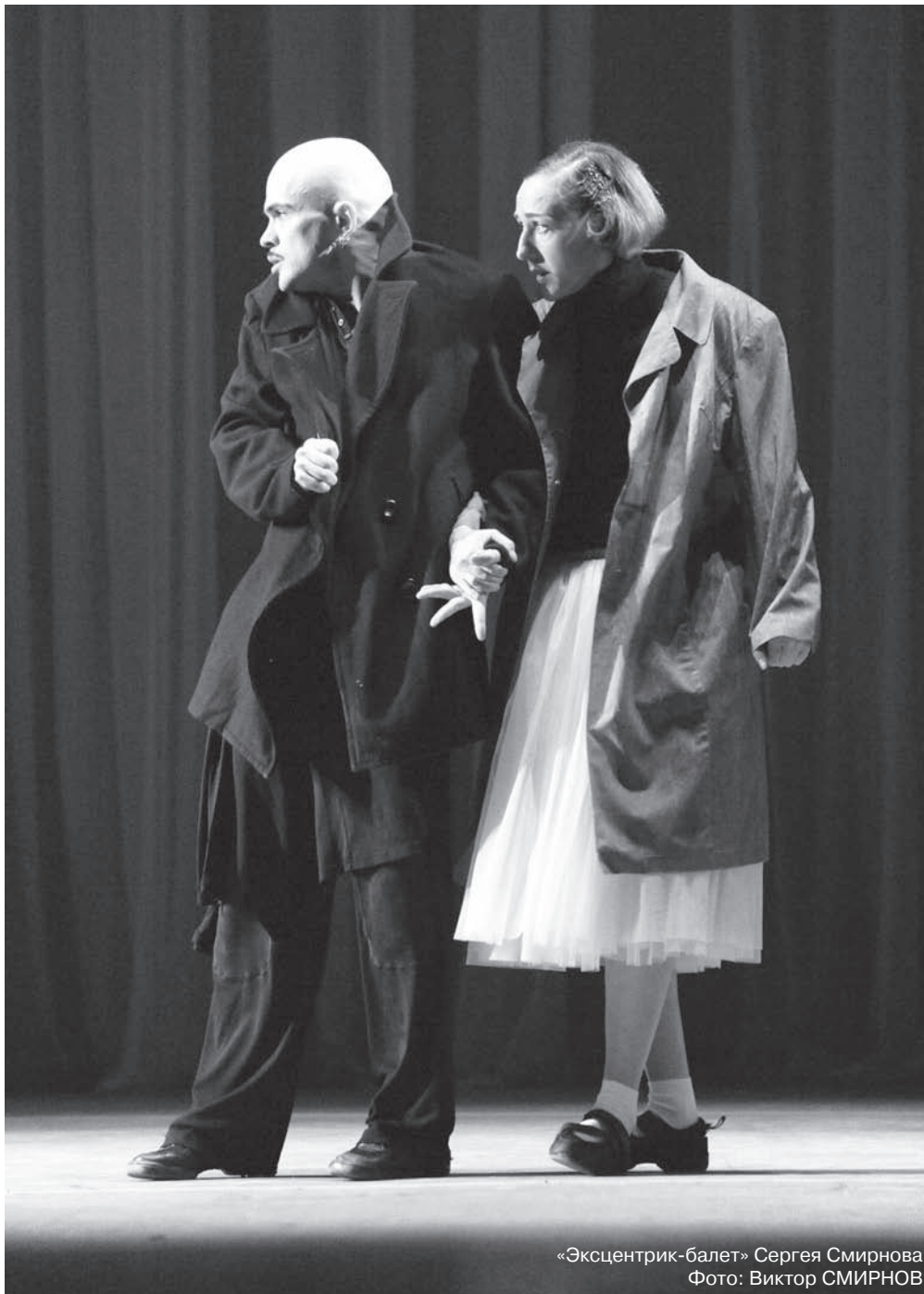
«Эксцентрик-балет» Сергея Смирнова