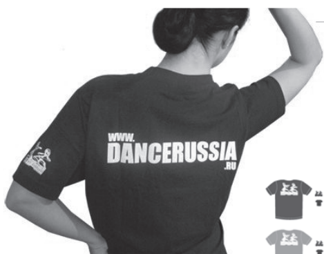
Цена: 260 руб.