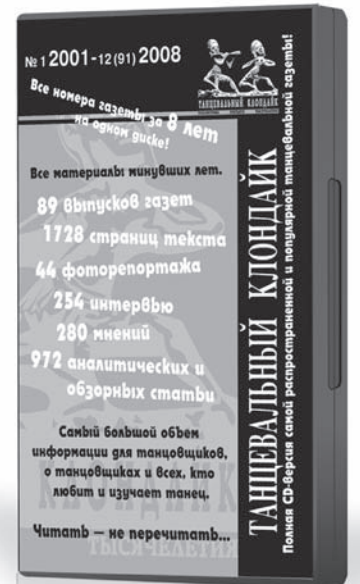
Цена CD-версии 120 руб.

Танцевальный Клондайк. Полная CD-версия самой распространенной и популярной танцевальной газеты!